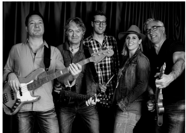
Rosewood, tête d'affiche résolument « country » pour la soirée du samedi 3 juin. A apprécier en live dès 19h30 !

Retrouvez les dernières infos relatives à cette soirée sur les réseaux sociaux.