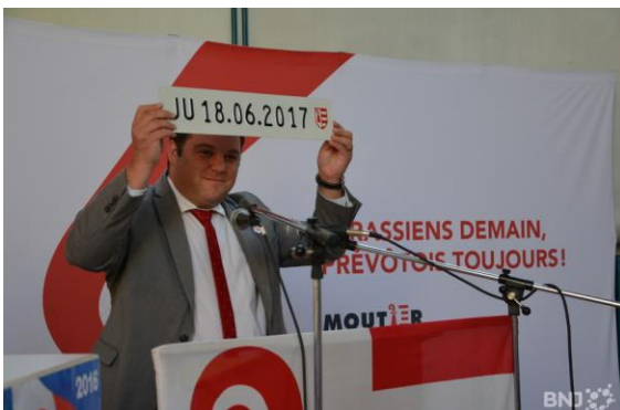
Les plaques « JU », on n'a pas fini d'en parler...

Plus sérieusement, voici ce qui a été constaté entre 6h00 et 8h00 du matin. Côté « restaurant des Gorges », nous avons compté 37 véhicules en plaques jurassiennes. Côté « autoroute A16 », ce ne sont pas moins de 59 voitures en plaques « JU » qui quittaient la cité prévôtoise en direction du Nord. (Pour la petite histoire, nous avons même aperçu une vieille Renault Clio avec des plaques françaises qui ne répondait plus aux prescriptions de sécurité depuis longtemps, sans parler de la législation sur les étrangers concernant son propriétaire, mais ça, c'est une autre histoire !). Bref, au total : nous avons vu au minimum 96 personnes passant la nuit à Moutier et retournant à leurs occupations sur le canton de Jura.