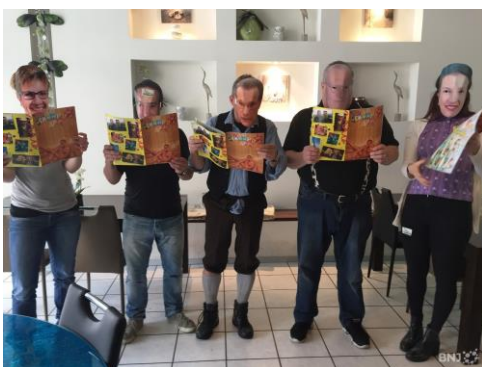
Les rédacteurs du Schnappou, dont le sens de l'humour est à sens unique... politique.

Le dernier numéro du « Schnappou », aurait pu apporter une légèreté bienvenue dans une campagne politique de plus en plus tendue et désagréable. Cela aurait pu être l'occasion que chaque personnalité prévôtoise en « ramasse pour son grade », peu importe son appartenance... Tout le monde aurait ri de bon cœur, et le Schnappou aurait rempli sa mission de « journal de Carnaval ». Or, il en a été tout autrement, car seul le camp probernois a été épinglé.